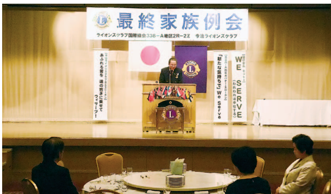
6月18日(木) 最終家族例会 (第1289回) 今治国際ホテル