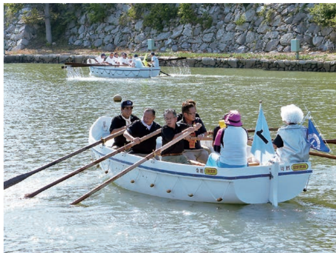
対今治東LC 大差の勝利