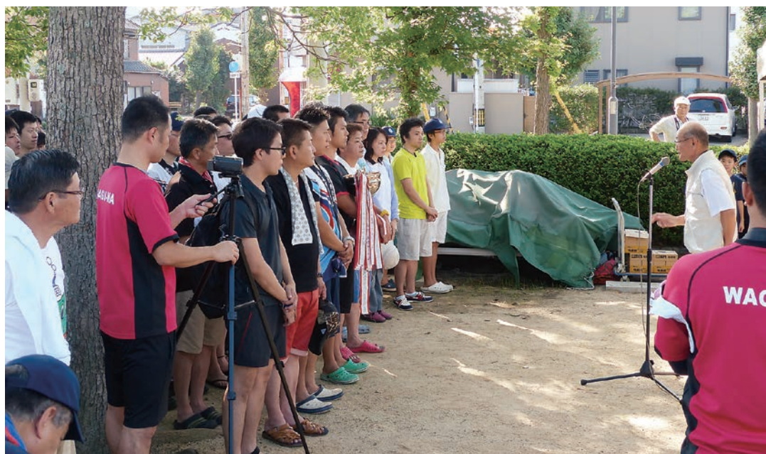
第24回今治市民カッター競技大会