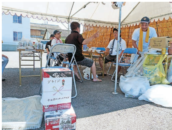
今治中央LC、今治東LCよりの戦利品