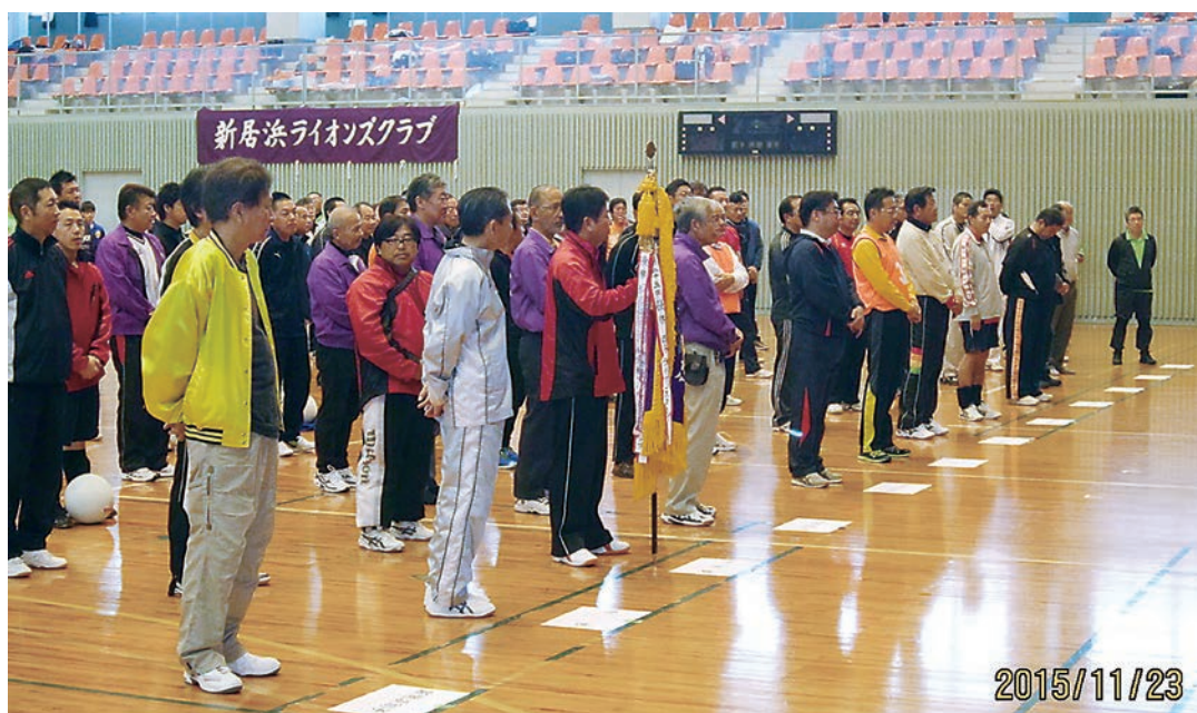
第43回 2R 親善スポーツ大会 開会式