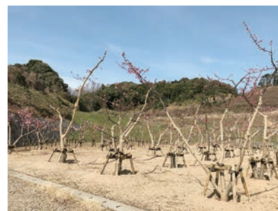
大谷墓園に仮移植された河津桜(2/24撮影)