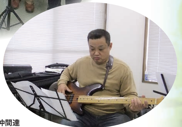
ミッチーとすばらしき仲間達 L-Spirits