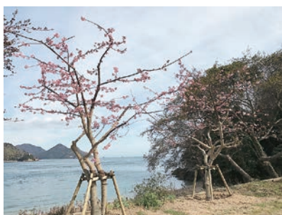
サンライズ糸山下の海岸沿いに移植された河津桜 (2/24撮影)