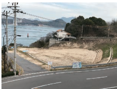
河津桜が元あったところ

右の写真のとおり、河津桜は全て無くなり拡張工事が進んでいました、案内板に書かれていますが河津桜は一部サンライズ糸山下の海岸沿い移植されています、また大半は大谷墓園のしまなみヒルズ側に仮移植されていました。拡張工事が終われば再びサンライズ糸山の敷地内に戻されるという事なので完成後が楽しみです。 (取材：PR委員会)