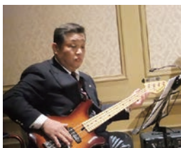
練習の成果を発揮した L-Spirits