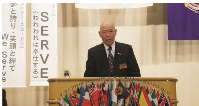
河端 RC 挨拶

今回我クラブがホストクラブという事もあり、メンバーの皆さんから大変ご協力を頂き誠に有り難うございました。今後もメンバーの皆さんと一緒に楽しい時間を過ごしていけたらと思います。