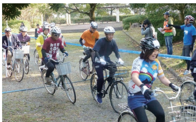
エキジビション 企業対抗ママチャリリレー2017