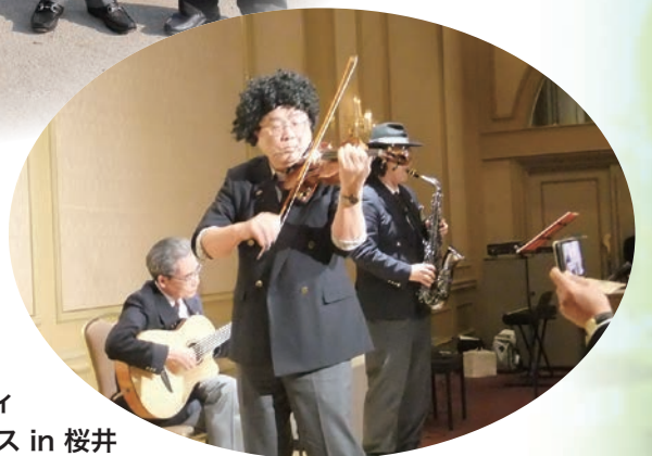
献血アクティビティ 今治湯ノ浦温泉シクロクロス in 桜井 2Z 合同例会懇親会