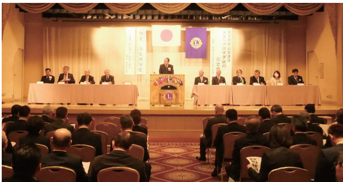
第45回 2R・2Z 合同例会 3月18日(土) 今治国際ホテル