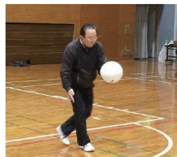
羽田野さん来年はレギュラー？