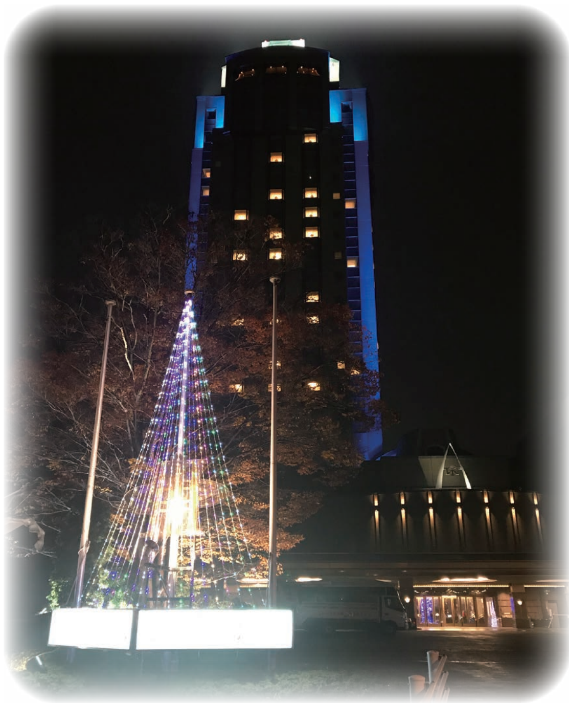
イルミネーション（今治国際ホテル）

ライオンズクラブ国際協会 336-A地区2R,2Z 12/2017 No.487