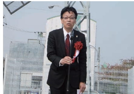
石川 RC 挨拶