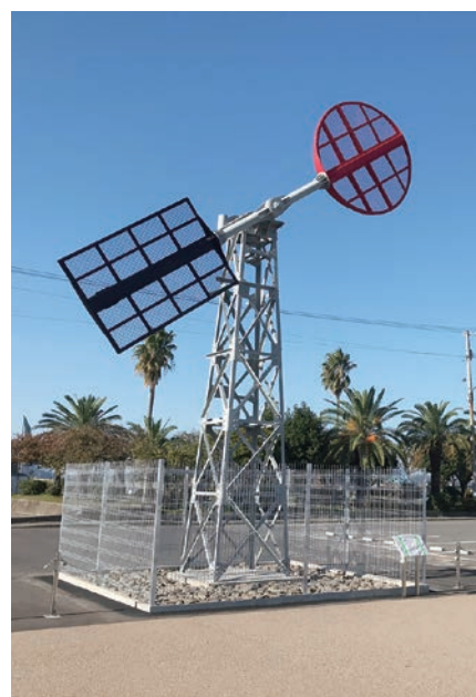
11月2日(木) 『腕木式昼間潮流信号機』復元移設 除幕式