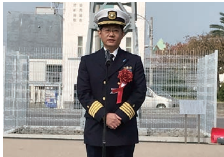
中津海上保安部長挨拶