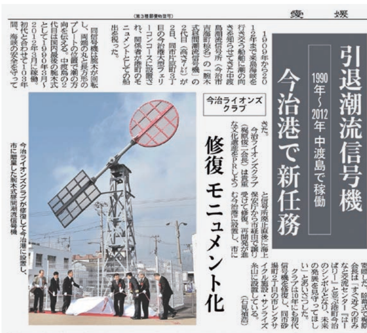
2017年11月3日(金) 愛媛新聞記事