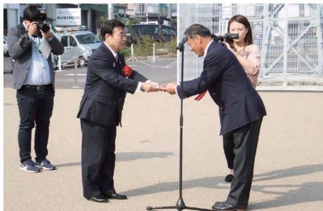
菅今治市長へ目録の贈呈