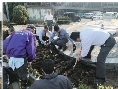
12月7日(木) 市役所前花時計花の植え替え