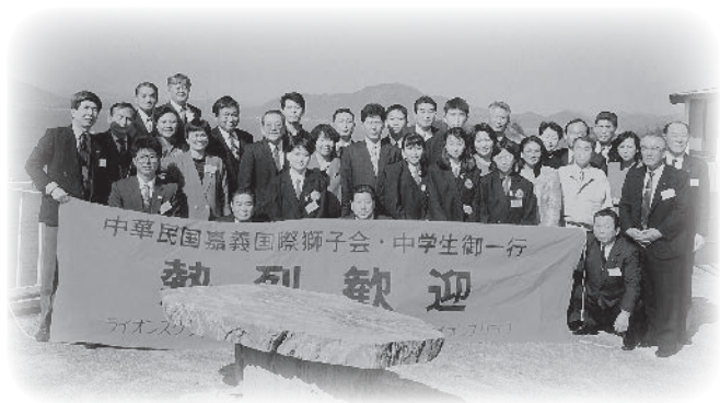
1993年 嘉義 LC からの嘉義市中学生受入れ