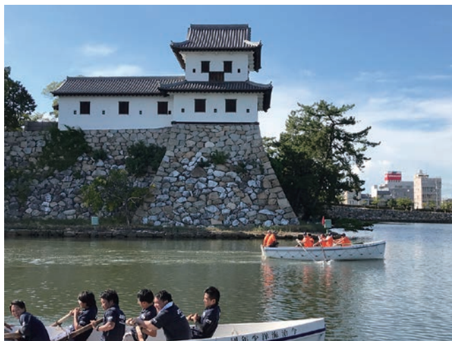
第2レースも余裕の勝利