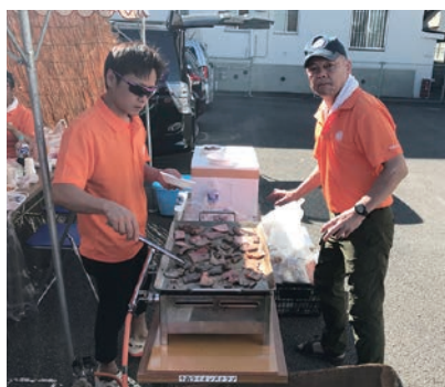
新・旧委員長が焼場担当？