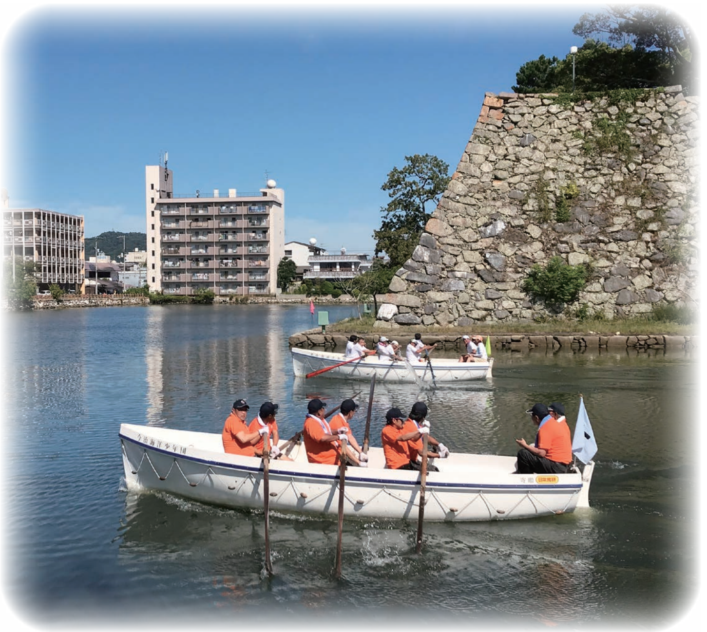
第27回今治市民カッター競技大会