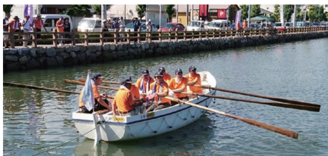
第1レースのメンバー