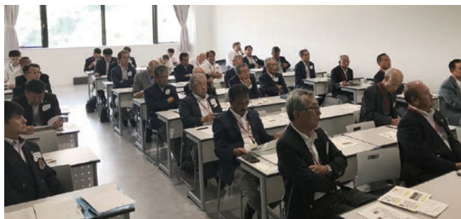
真剣に卓話を聞くメンバー