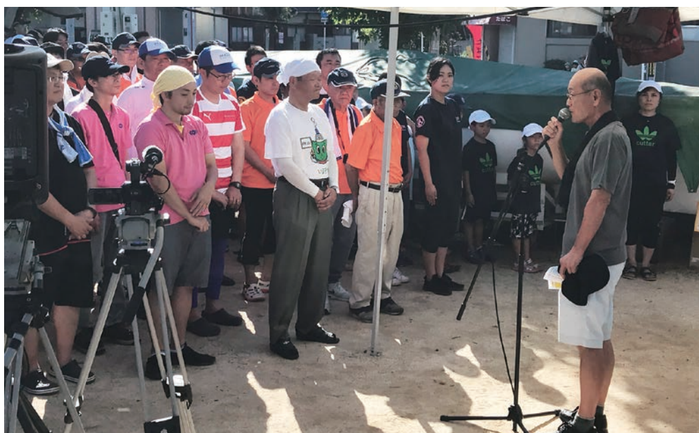
第27回今治市民カッター競技大会 開会式