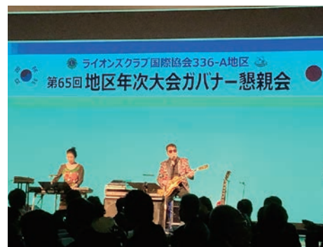
ガバナー懇親会（レーモンド松屋）