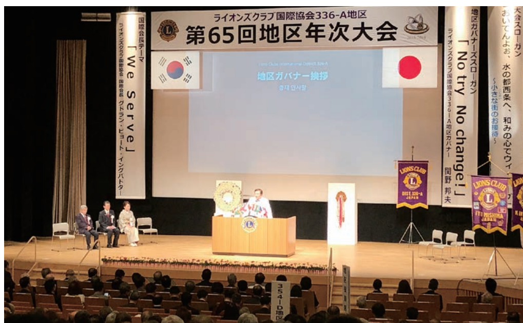
第65回地区年次大会