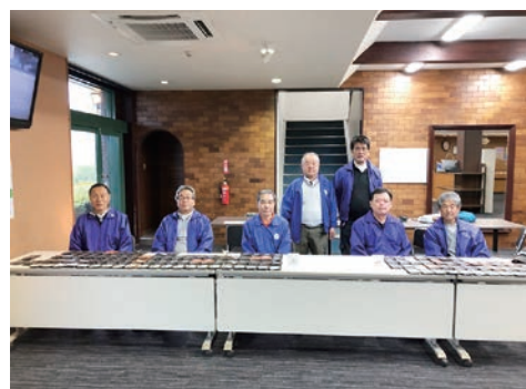
記念ゴルフ 道後 GC