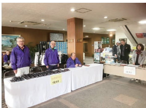
記念ゴルフ 今治 CC