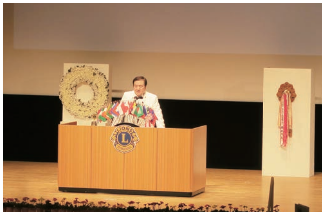
関野地区ガバナー年次報告

ガバナーズアワードでは、今治ライオンズクラブは、34部門のうちクラブ会報優秀賞（金賞） マスコミ