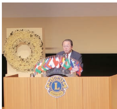
羽田野指名選挙委員会委員長