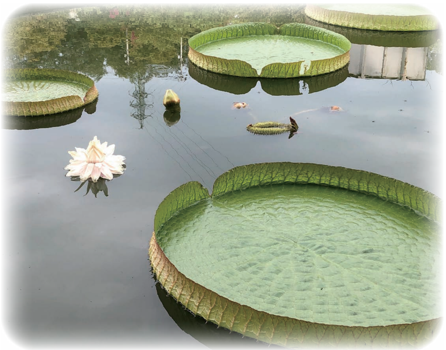
オオオニバス（今治市民の森フラワーパーク）