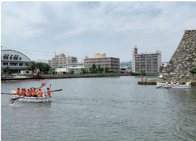
中央 LC に快勝