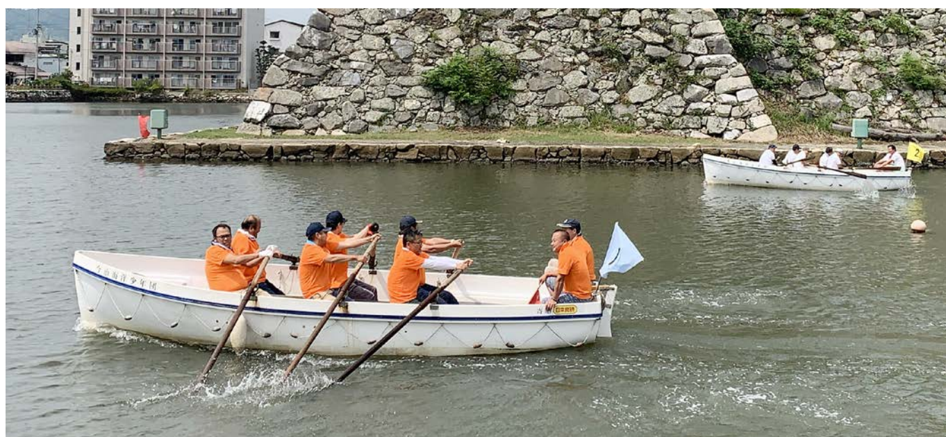
第28回今治市民カッター競技大会