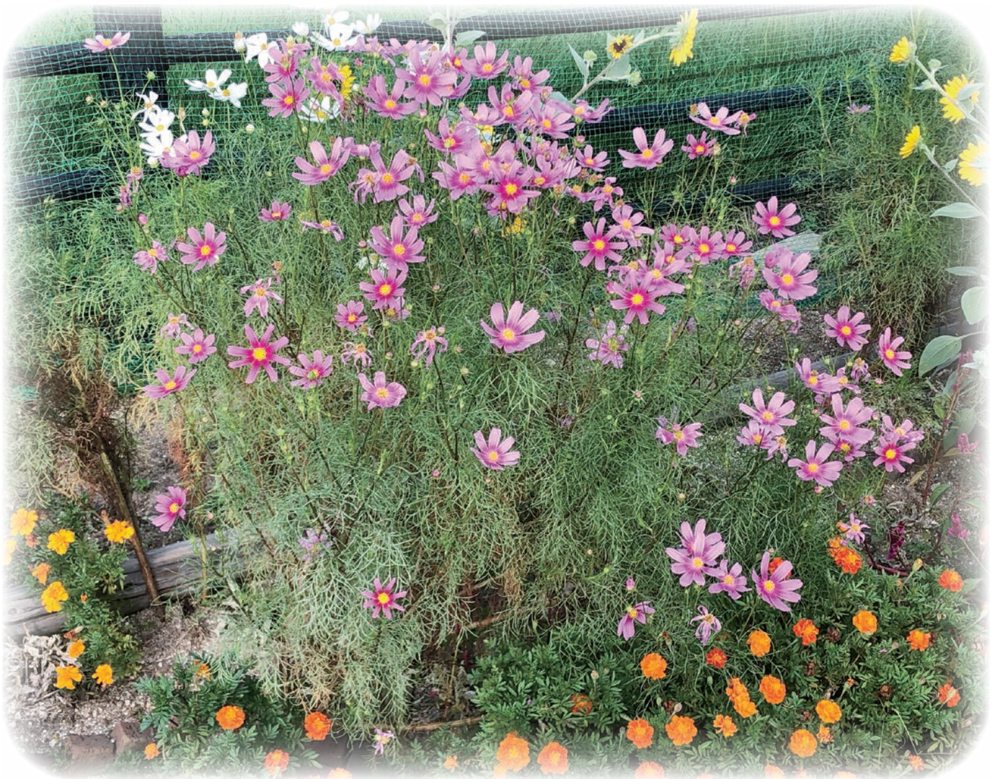
コスモス（しまなみアースランド）

ライオンズクラブ国際協会 336-A地区2R,2Z 10/2019 No.509