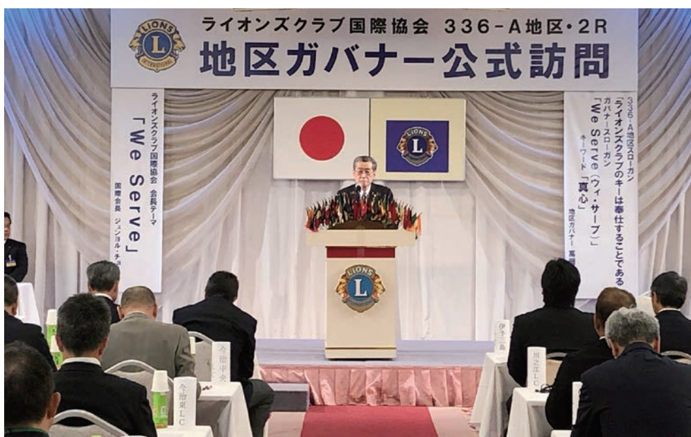
2R 地区ガバナー公式訪問