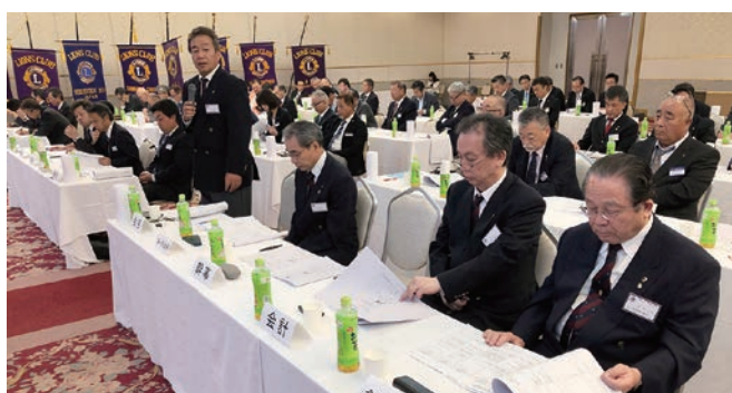
今治 LC 出席者