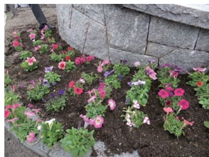
3月5日(木) 市役所前花時計花の植え替え