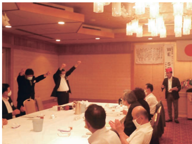
テールツイスターの時間