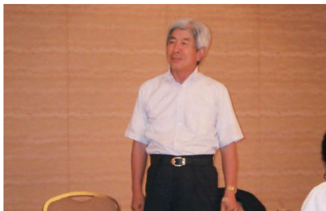
鳥井先輩 エイジシュートおめでとうございます