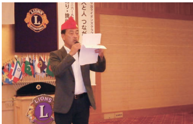
テルツイスターの時間 村上テルツイスター