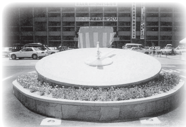
1989年 今治市役所前に設置された花時計