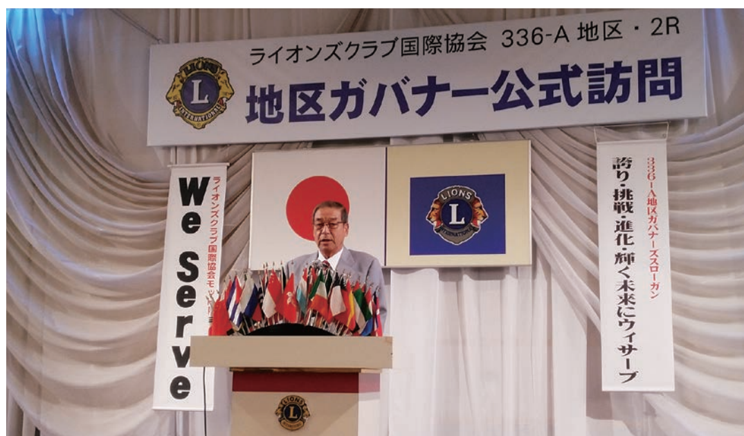
地区ガバナー公式訪問