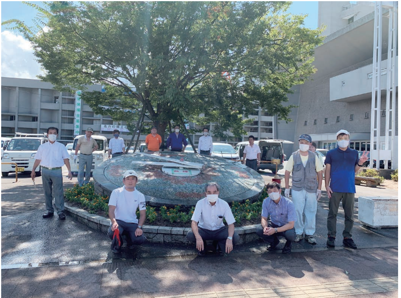
市役所前花時計花の植え替え

ライオンズクラブ国際協会 336-A地区2R,2Z 10/2020 No.521