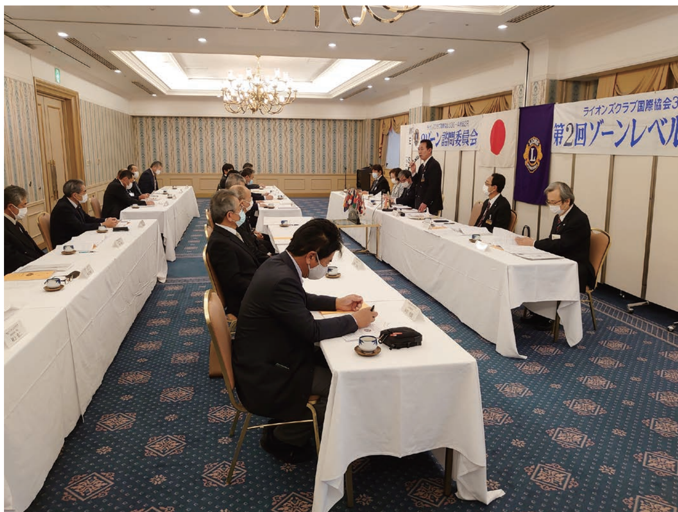
2Z 第2回地区ガバナー諮問委員会並びにゾーンレベル会員委員会