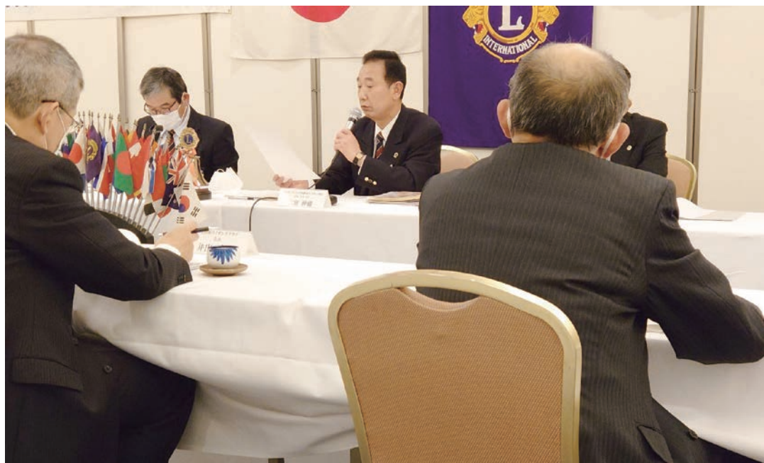
12月12日(土) 2Z 第2回地区ガバナー諮問委員会並びにゾーンレベル会員委員会