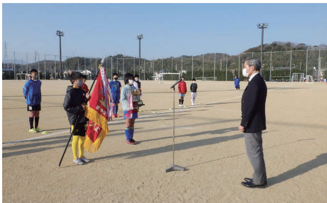
2月21日(日) 第29回今治ライオンズクラブ旗争奪少年サッカー大会 優勝旗返還