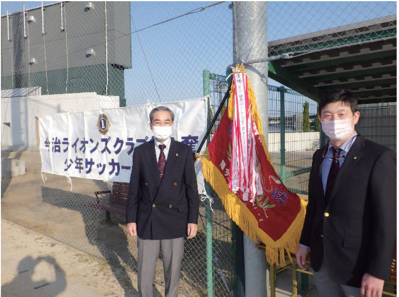
第29回今治ライオンズクラブ旗争奪少年サッカー大会