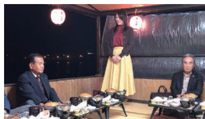
日田 LC 宮崎会長 歓迎の挨拶