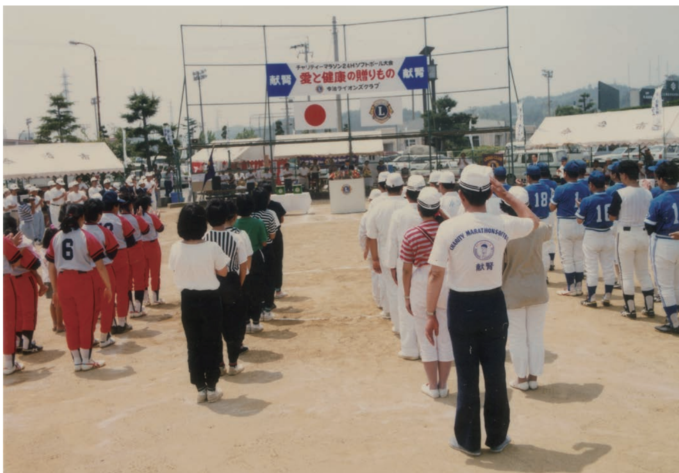
1988年～1989年 メインアクティビティ 献腎チャリティーマラソンソフトボール大会開会式