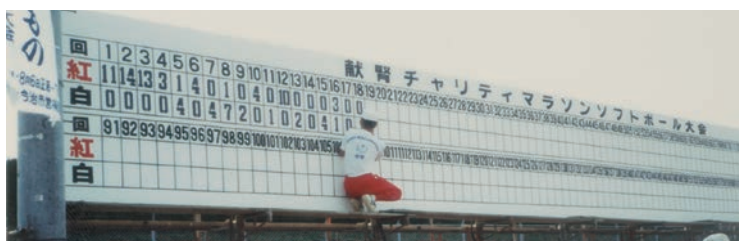
スコア係も大忙し