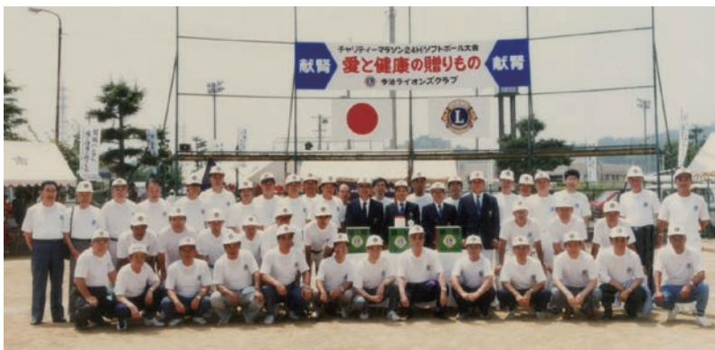
会員揃ってハイ、チーズ。ごくろうさまでした!!