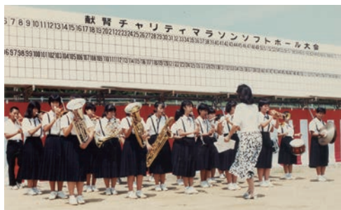
ブラスバンドの演奏もムードを盛り上げる。