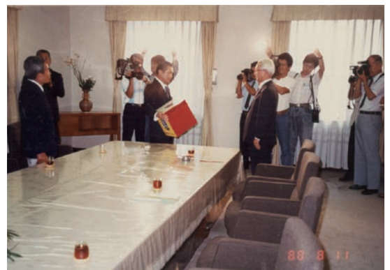
チャリティー基金1,338,675円贈呈式