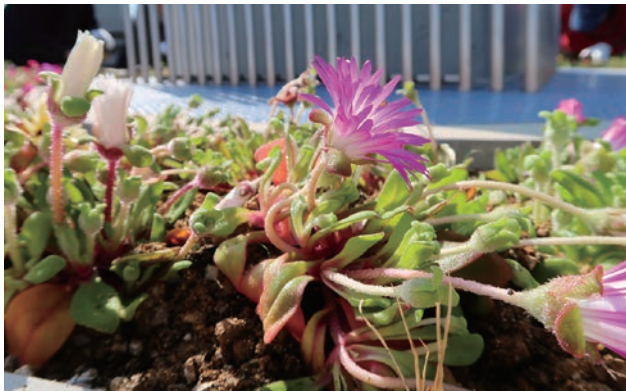
リビングストーンデー