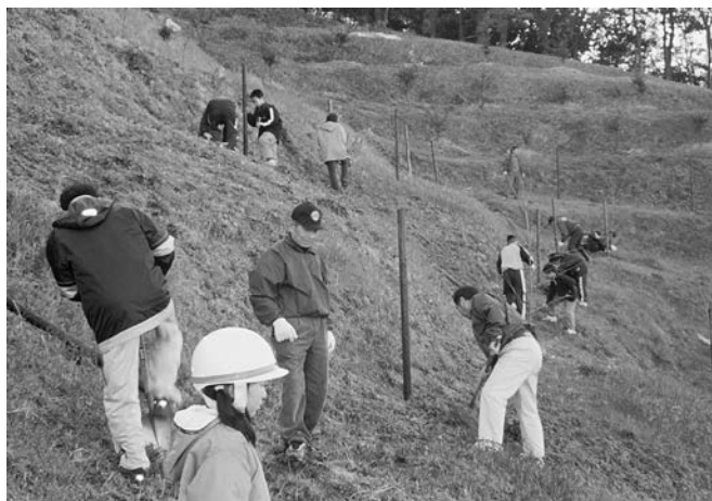
波方町海山城公園

河津桜（かわづざくら）緋寒桜と早咲き大島桜の自然交配種と考えられ、開花期が早く大柄な花が特徴。開花は二月上旬から三月上旬まで約一ヶ月。花は温かみのある淡いピンク色で、花径は約三センチメートル。地上近く（約五十センチメートル）から幹が別れ、枝は横に広がる性質がある。