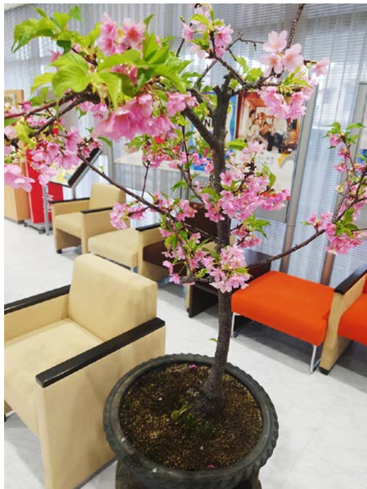
愛媛銀行ときわ支店ロビーにて

3、4年後に花が散った後、油粕の有機肥料をやったところ、翌年には花が咲きませんでした。色々調べてみると桜は花が散った後は有機肥料のような強い肥料ではなく、液肥のような肥料を散布し、強い