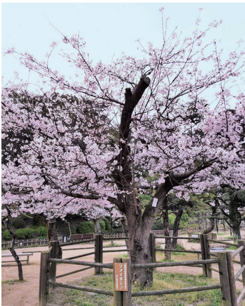
道後公園 ソメイヨシノ標本木 (4Pへ続く)