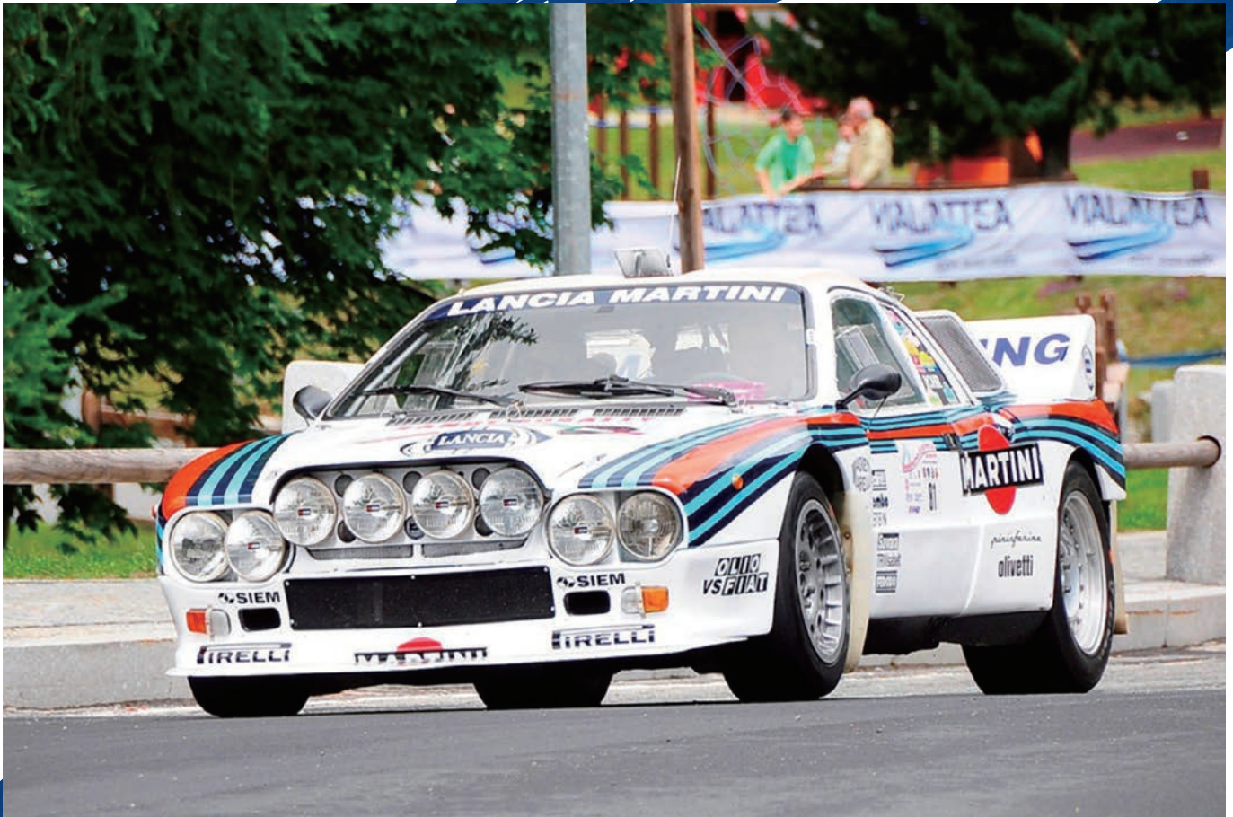
憧れの車 ランチア・ラリー037 (8Pへ続く)