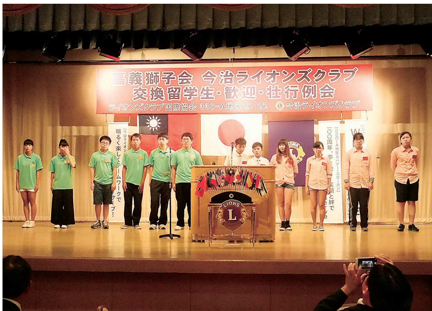
今治ライオンズクラブ結成55周年事業 高義 LC 国際交流交換留学事業

ライオンズクラブ国際協会336-A地区2R,2Z 3・4/2026 No.573